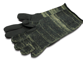
Sovraguanti in maglia RGXSG