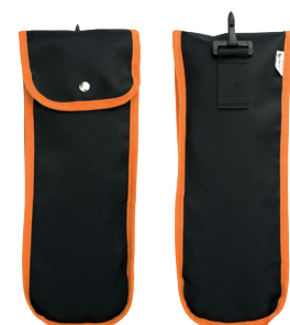
Cistodia per il trasporto di guanti RGX-SAC