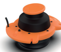
Verificatore pneumatico per guanti ø 100 mm EOSE9030