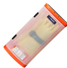
Contenitore per guanti RGX-BGT